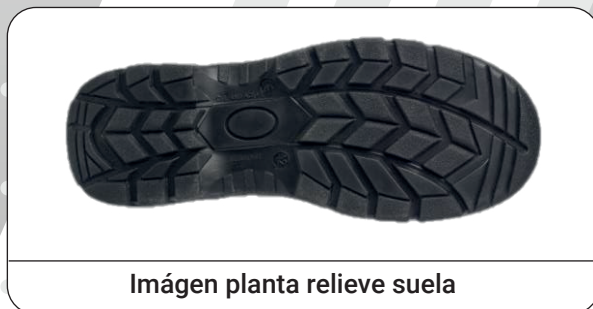
Imágen planta relieve suela