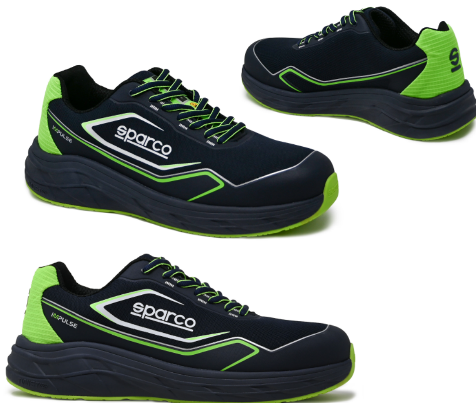
WILLEN ESD S1PS SR FO HRO 07545tgBMVF