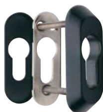
Detalle del escudo E210