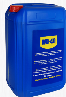
Bidón 25 litros

Garrafa para uso industrial que viene acompañada de un pulverizador para una más sencilla aplicación