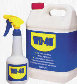
Garrafa 5 litros

El formato Doble Acción permite una aplicación amplia o precisa del producto, garantizando que nunca se perderá la cánula