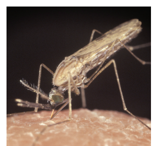
Anopheles gambiae (MALARIA)