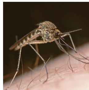
Culex pipiens (COMÚN)

El ANTIMOSQUITOS HOGAR previene de picadas de las siguientes familias de mosquitos; mosquito común ( Culex pipiens ), mosquito tigre ( Aedes albopictus ), del mosquito del dengue ( Aedes aegypti ), y de la malaria ( Anopheles gambiae ). Pruebas en universidades y laboratorios externos independientes avalan la tecnología INSONUERIT1.0 .