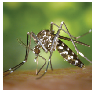
Aedes albopictus (TIGRE)