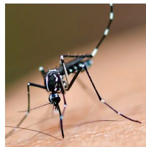
Aedes aegypti (DENGUE)

¿Sabías que estudios científicos muestran que son los mosquitos hembra los únicos que pican para ingerir sangre para desarrollar los huevos cuando están en estado de gestación?. Los machos pueden revolotear a tu alrededor pero son inofensivos porque se alimentan de sustancias azucaradas (néctar y exudados de frutas) aunque las hembras también.