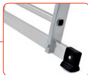
Barra stabilizzatrice con piedini antiscivolo Non-slip stabilizer bar