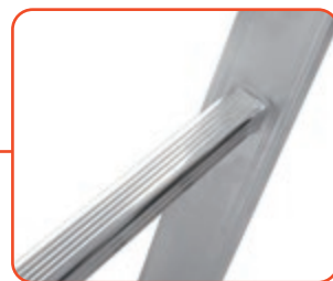
Piolo 25x25 mm, a sezione quadrata (tutti i pioli) 25x25 mm rung, squared (all rungs)