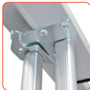
Gancio in alluminio, completo di dispositivo antisfilo Aluminium hook as non-slipping device