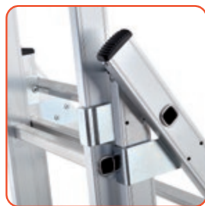
Articolazione in acciaio Steel hinge