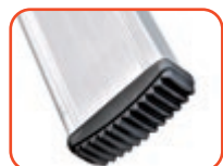
Piedini antiscivolo, massima aderenza al terreno Non-slip feet, high grip